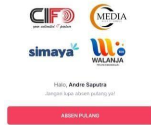
Gambar 6. Halaman Selesai Absen

Pada halaman ini akan tampil keterangan bahwa karyawan sudah berhasil melakukan absen masuk. Jika karyawan akan pulang, karyawan bisa klik button “Absen Pulang”.