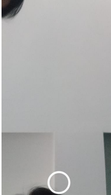
Gambar 4. Halaman Ambil Gambar

Pada halaman ini karyawan akan mengambil gambar wajah atau lokasi kerja sebagai bukti bahwa karyawan tersebut masuk dan berada di wilayah kantor.