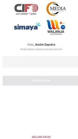
Gambar 2. Beranda

Halaman beranda berisi sambutan oleh aplikasi diikuti dengan nama lengkap karyawan dan pemberitahuan bahwa karyawan tersebut belum melakukan absen.